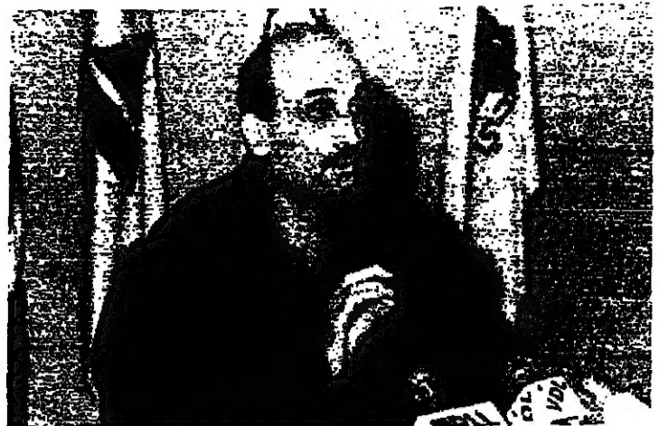
الدكتور ججاج خلال نوبته الصحفية (جوزيف فوفول)

شرح قائد القوات اللبنانية الدكتور ججاج بالتفصيل طرحه اعتماده لفرقته حلاً لازماً في لبنان، مجدداً هذا الطرح مؤكداً على أهمية الاعتراف بواقع لبنان التعددي ومن ضمنه لضرورة الوطنية كحل ثابت وواضح لضرورة اللبنانية.